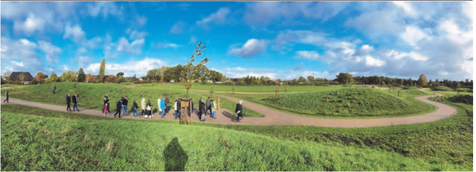
Impression von der Führung übers Gelände