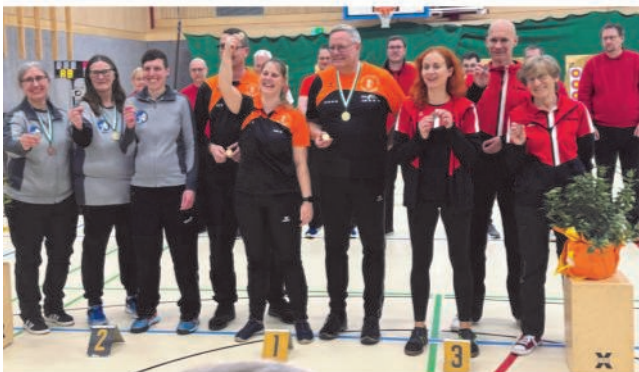
Impressionen von der Landesmeisterschaft in Embsen